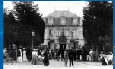
Le "Beauséjour", premier grand hôtel de la station

Le développement de la station bascule vers le nord avec la mise en vente par l'Etat des terrains achetés dans les années 1870 par la Compagnie des Charentes. En témoignent la construction d'une nouvelle gare, l'inauguration d'un casino en 1890 et l'ouverture du premier grand hôtel ( hôtel Beauséjour ).