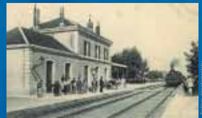
La nouvelle gare marque le début de l'extension de la station vers le nord

La construction de ces terrains proches de la gare aurait pu déplacer la centralité de la station, si le sud n'avait pas été déjà fortement structuré par le lotissement Fauconnier. Châtelailillon présente alors de plus en plus clairement un plan géométrique et une organisation bipolaire.