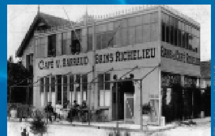
Les établissements de bains de la station sont de taille modeste

L'aménagement d'un jardin public et d'un boulevard de la plage dans les années 1900, l'installation d'établissements de bains ( Bains des fleurs, Vantadoux, Lamy, Richelieu, Guilloteau ) ainsi que l'ouverture d'un établissement d'hydrothérapie en 1906 parachèvent l'édification de la station. Jeux, bals et spectacles proposés au sein du casino, concerts donnés dans le kiosque à musique assurent la distraction des touristes.