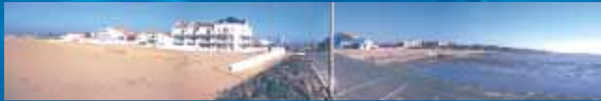
Panoramique de la partie sud de la plage

La municipalité décide de relancer le tourisme en s'engageant, à partir de 1989, dans une vaste opération de réensablement de la plage et de réhabilitation du front de mer. Elle cède à un promoteur privé le casino et son parc. Celui-ci s'intègre à un vaste programme immobilier de 270 logements de vacances, à l'architecture moderne inspirée du style balnéaire.