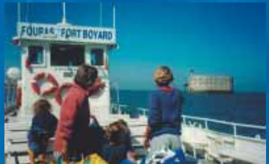
Les forts de l'embouchure de la Charente (ici Fort Boyard) constituent aujourd'hui une attraction touristique

Son panorama et sa fonction d'embarcadère vers l'île d'Aix, dernière île charentaise accessible par bateau, en ont fait le deuxième pôle d'animation de la station, où se concentrent désormais de nombreux restaurants.