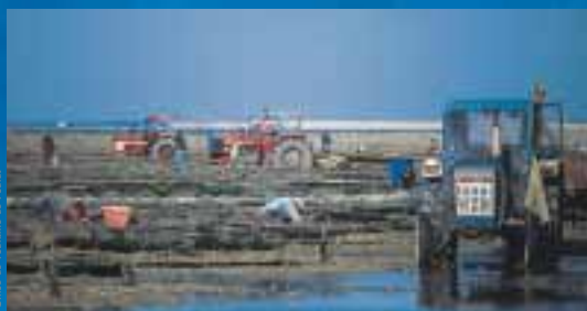
L'ostreiculture participe de l'image touristique du littoral charentais

Fouras s'appuie également sur la valorisation de sa presqu'île. La Pointe de la Fumée, importante zone ostréicole, s'affirme comme un site touristique majeur du littoral.