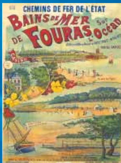
Affiche du musée régional : Fouras mise sur la valorisation de son patrimoine

Cependant, Fouras n'est plus seulement une station touristique car elle est gagnée par l'urbanisation progressive du littoral. Le long déclin démographique entamé depuis les années 1950 semble enrayé par l'installation depuis 1990 de retraités et d'actifs travaillant à Rochefort et à La Rochelle.