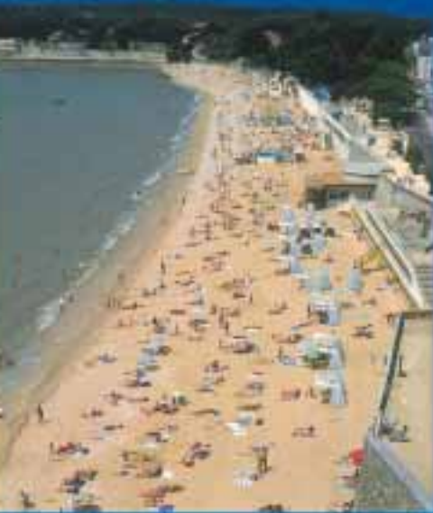
La Grande plage