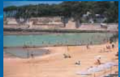
La retenue d'eau aménagée dans les années 1980

Dans la zone de baignade de la Grande Plage, la piscine d'eau de mer, en mauvais état, est détruite en 1975. Elle est remplacée en 1983 par une retenue d'eau plus large, utilisable quelque soit le niveau des marées.